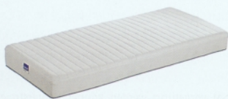
«Privilège» – ein neuartiges Schlafgefühl

Der modulare Aufbau der «Privilège» ermöglicht erstmals eine genaue Anpassung der Matratze an individuelle Kundenbedürfnisse. Der Kunde kann über den Basiskern den Komfort und über die austauschbaren Auflagen das Klima seiner Matratze selbst bestimmen. Die einzelnen Auflagemodule ermöglichen auch eine einfache Reinigung. Zudem kann den verändernden Bedürfnissen des Kunden an das Schlafklima durch eine andere Auflage schnell und günstig Rechnung getragen werden. Solche Möglichkeiten bestanden bei den herkömmlichen Matratzendesigns nicht.